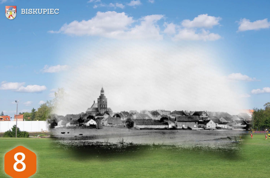
8 PARK MIEJSKI 1911r. Widok na pastwisko, które wówczas nosiły miano Łąk Dymerskich. W połowie XIX w. cały dzisiejszy park obejmowało lustro stawu młyńskiego. W miarę lat staw obniżał się, a niski poziom wód uniemożliwił pracę młynów. W 1806 r. podniesiono więc tamę, ale wskutek nadmiernego spiętrzenia zostały podtopione ogrody i grobla młyńska. W 1808 r. dokonano ponownej regulacji. W połowie XIX w. na szeroką skalę podjęto roboty melioracyjne i staw młyński stał temu na przeszkodzie, toteż w 1844 r. korporacja melioracyjna młyn wykupiła i w 1861 r. woda ze stawu została spuszczone.