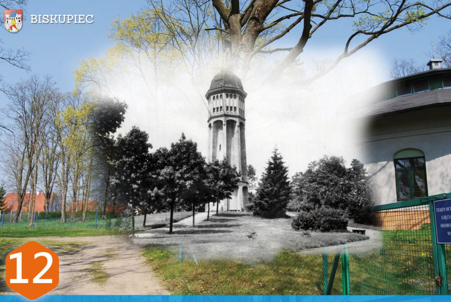
12 WIEŻA CISNIEN 1932r. Gdy w 1913 r. założono w mieście wodociąg i kanalizację, daleko za miastem, na wzgórzu przy ulicy Leśnej (Kiedys Waldstrasse), zbudowano wieżę wodną, a w pobliżu niej dwie studnie głębinowe. Wieża ciśnienia była wówczas drugim po kościele św. Jana najbardziej rozpoznawalnym symbolem miasta, mierzącym 39 m wysokości. Dopiero w latach 1934-35 zbudowano w tym rejonie osiedle domków jednorodzinnych.