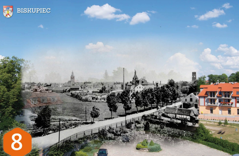
8 PARK MIEJSKI 1929r. Pomiędzy stawem, a ulicą Żółkiewskiego (Richt Straße) znajdował się wodopój dla bydła. Po jego osuszeniu 1861 r. przy ul. Warszawskiej zbudowano remizę strażacką, którą w 1906 r. zastąpiła nowa, zlokalizowana na dawnym placu ćwiczeń u zbiegu ulic Sądowej i Strażackiej. W związku z istniejącą w tym rejonie szkołą średnią, która rozbudowano w 1934 r. (obecny budynek gimnazjum przy ul. Ludowej), urządzono dogodny trakt pieszy (Dimmerweg) łączący Al. Wojacka Polskiego (Mühlendamm) z ulicą 1 Maja (Adolf Hitler Straße), który przebiegał w miejscu dawnego stawu młyńskiego.