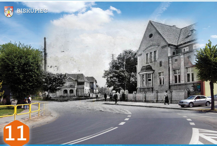
11 ARMII KRAJOWEJ 1924r. Widok na willową zabudowę u zbiegu ul. Armii Krajowej (Herrmannstraße) i 1 Maja (Hitler Strasse). Ul. Armii Krajowej jeszcze u schyłku XIX w. miała charakter drogi polnej, gdzie tradycyjnie mieścił się dom dla czterech pastuchów miejskich, których zadaniem był wypas bydła na pobliskich łąkach Dymerskich. Charakter tej ulicy zmienił się zasadniczo dopiero po I Wojnie Światowej. W 1926 r. stanął tu jako ostatni budynek mieszkalno - administracyjny, do którego przeniesiono z Reszla urząd katastralny.