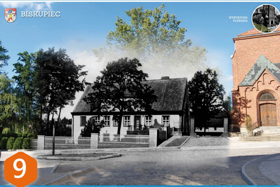
9 BUDYNEK PLEBANII 1936r. Budynek nowej wówczas plebanii wzniesiony w 1930 r. Na początku lat 30. XX w. podjęto decyzję o obniżeniu wzniesienia kościelnego o 60 cm oraz wyburzeniu dawnej siedziby proboszcza, (budynek nachodził na dzisiejszą ulicę 1 Maja) dzięki czemu zlikwidowano istotną przeszkodę komunikacyjną, a kościół zyskał nowe schody wejściowe.