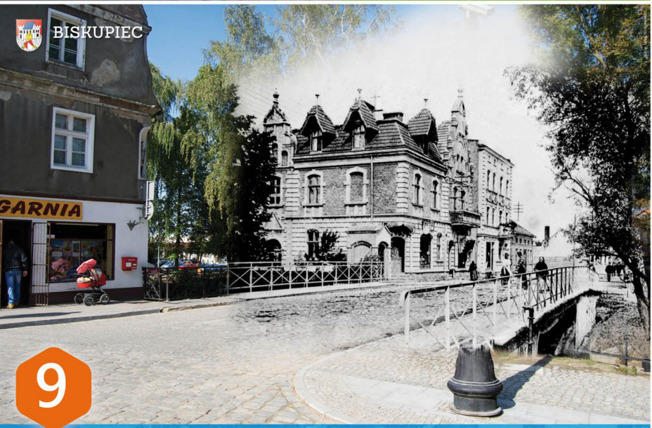
9 WIDOK NA MOST ŚW. JANA 1927r. Widok na most i nie istniejącą już zabudowę na Rönigberger Straße, ulicę która niegdyś była jedynym traktem prowadzącym na północ. Jej początek zaczynał się od dzisiejszej ul. Pionierów i prowadził w ciągu 1 Maja, aż do ul. Niepodległości. W latach 30 ulica została przemianowana na Adolf Hitler Straße. Przed mostem mieścił się kościół garnia, z której naczelnika na rzekę spogląda figura św. Jana Nepomucena. Jest patronem mostów i przepraw przez rzeki oraz opiekunem życia rodzinnego. Jak głosią przekazy ludowe, chroni pola i zasiewy przed powodzią. Jego figury, tzw. nepomuki, można spotkać jeszcze przy drogach w sąsiedztwie mostów i rzek oraz na skrzyżowaniach dróg.