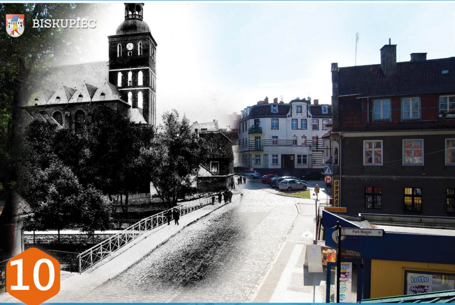
10 WIDOK NA KOŚCIÓŁ 1907r. Zdjęcie wykonane z nieistniejącej już zabudowy przedstawia most nad rzeką Dymier. W tle budynek starej plebanii oraz kościół Św. Jana Chrzciciela. Pierwotnie na terenie tym znajdował się cmentarz. W 1930 r. przy regulacji ulicy i wyburzeniu budynku starej plebanii natknięto się na liczne pochówki. Dopiero w połowie XVIII w. podjęto decyzję o zaniechaniu chowania zmarłych w tym rejonie, a po zburzeniu murów obronnych przedłożono go w kierunku wschodnim tak, że jedynie 20 kroków oddzielało go od ul. Ogrodowej.