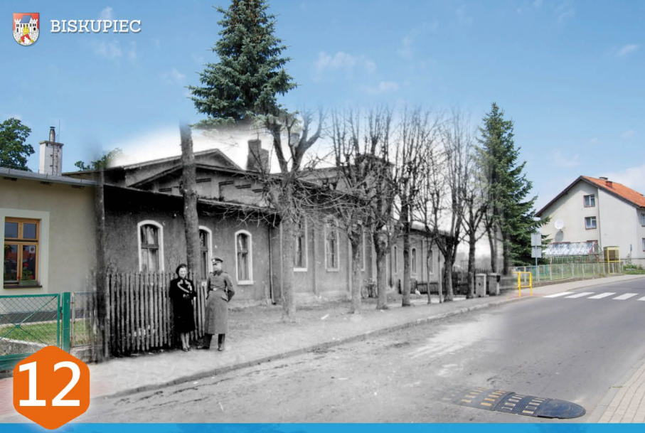
12 DOM KULTURY 1937r. Ulica Matejki (Schützenweg) została wytyczona w 1906 r. jako boczna od Kościuski (Roseler Strasse), w związku z uruchomieniem przez Bractwo Kurkowe strzelnicy, do której prowadziła (obecny budynek Biskupickiego Domu Kultury). Z czasem teren między strzelnicą, a wieżą ciśnienia stał się jedynym miejskim parkiem, w którym mieszkańcy miasta chętnie spędzali swój wolny czas.

Historia Biskupca wiąże się z wieloma interesującymi faktami. Do dziś na jego ulicach znajdziemy ślady dawnych wydarzeń. Zachęcamy do wyruszenia szlakiem historycznych tablic, na których zobaczycie Państwo i przeczytacie o Biskupcu sprzed lat. Porównajcie to, co widnieje na zdjęciach z tym, co zobaczycie na żywo i przyznajcie z nami, że Biskupiec to krajobraz pełen możliwości!